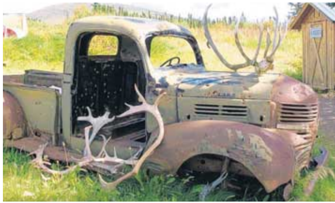
Stilleben in der Landschaft