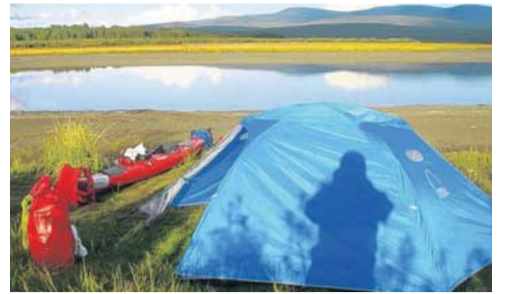
Abenteurer auf Zelt-(Lein-)wand

Sanft erfasst die Strömung des schillernden Rose River mein Kajak. Ich konzentriere mich auf die erste Biegung des Flusses. Als ich wieder zurückschaue, sehe ich nur noch dicht bewaldetes Flussufer. Ein Weißkopf-Seeadler landet dort auf der Spitze einer Kiefer, blickt aufmerksam zu mir herunter. Mein Plan war klar: Den Rose River neun Kilometer runterpaddeln bis zur Mündung in den Nisutlin River, diesem dann 180 Kilometer folgen, bis sich der Fluss in die Nisutlin Bay ergießt. Schließlich über die Bay paddeln bis zum Flecken Teslin am Alaska Highway, genau dort, wo auch der riesige Teslin Lake beginnt.