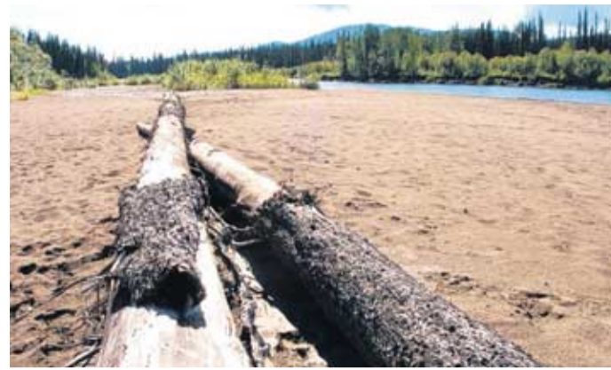
Treibholz am Fluss