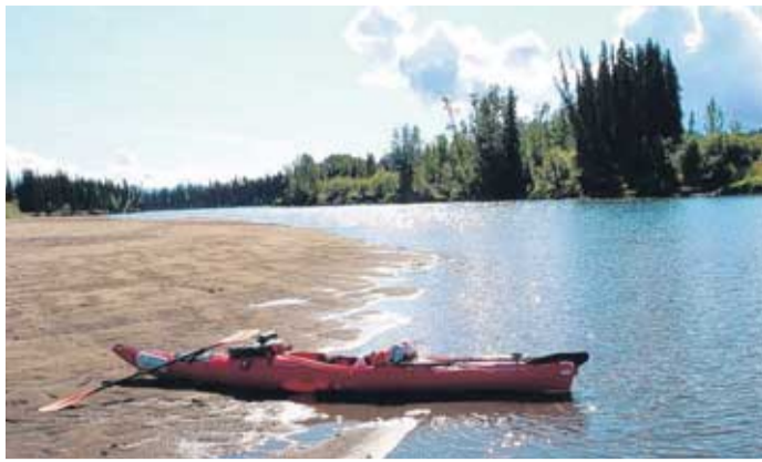
Kajak auf der Sandbank