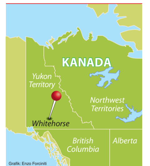
Grafik: Enzo Forciniti

Morgens, beim Blick aus dem Zelt, empfangen mich einige Male feines Morgenrot, Boden-Nebel und Temperaturen um die Null Grad. Beim Zeltabbau werden die Hände ziemlich klamm, Handschuhe